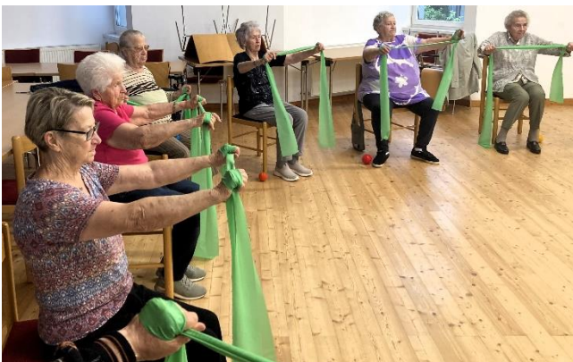
„Fit mit NACHBARSCHAFTSHILFE PLUS“

Für diese wertvolle Unterstützung gebührt ihnen großer Dank und Anerkennung!