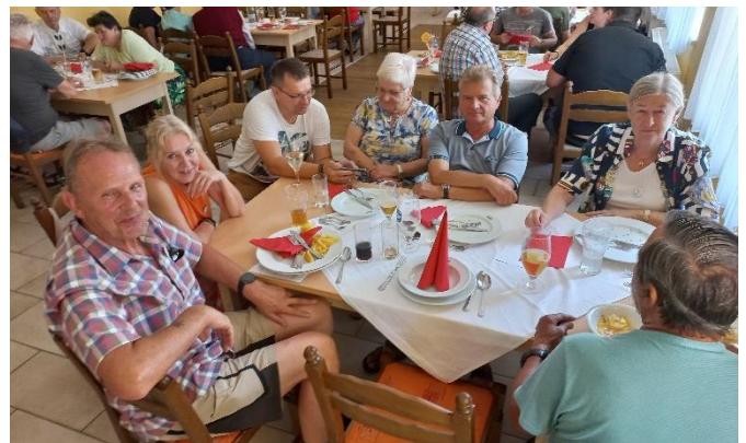
„Mahlzeit miteinander“ mit NACHBARSCHAFTSHILFE PLUS

NACHBARSCHAFTSHILFE PLUS wünscht Ihnen ein gesegnetes Weihnachtsfest sowie Glück & Gesundheit im neuen Jahr 2025!